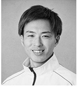
4166 吉田 拓郎